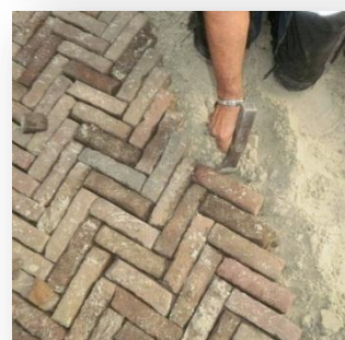
het echte handwerk